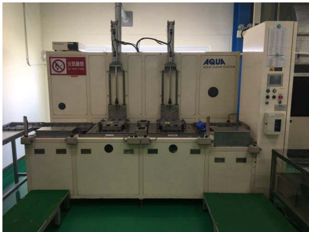
炭化水素系洗浄機