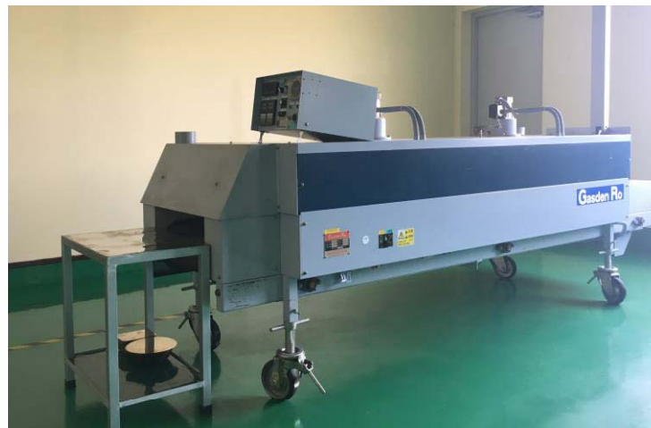
熱処理設備【ベルト炉】