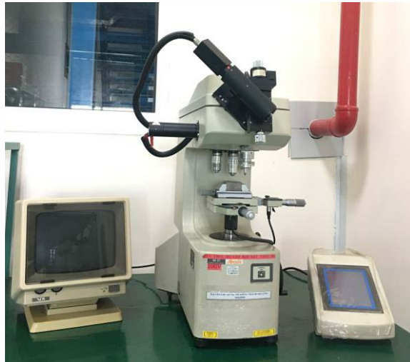
硬度計【ビッカース】