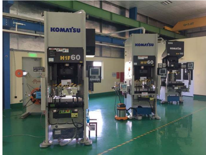
60T・110T サーボプレス機